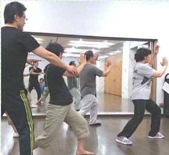
妊婦さんの胎教にも！

水の中のような心地よさ。インナーマッスルを鍛えるから普段の生活がずっと楽に！丈夫な気のシールドを身につけ重要なテーマを特化した整体 90 分コース